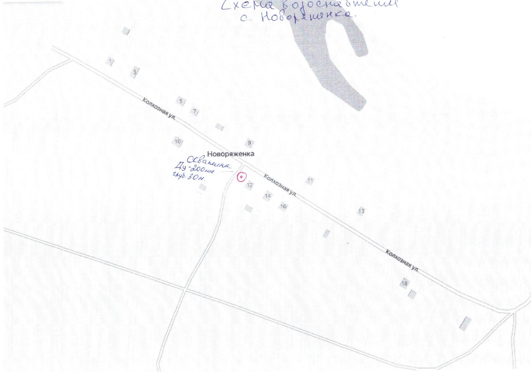
Схема воююкбтешн с. Новоряженка.